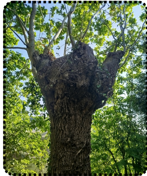
Vielle trogne de chêne

Autrefois, les branches étaient utilisées comme fourrage, mais pour éviter que les animaux ne les broutent directement, elles étaient coupées en hauteur, hors de leur portée. Ce qui a donc créé les trognes.